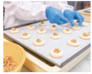
梵天丸製造の様子

A しょうゆ、胡麻、抹茶味の3種類のくるみゆべしを、最大で1日1万個製造しています。定番のくるみゆべしは、創業時からの製法を現在も変わらず受け継ぎながら、その味を守り続けています。また、現在はくるみゆべし以外に、梵天丸(ぼんてんまる)という焼き菓子なども製造しています。