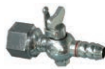
ヒューズ機能のないガス栓

ヒューズガス栓は、万が一ゴム管が外れたり、途中で切れたりして多量のガス漏れがあった場合、自動的にガスを止めます。ご自宅にヒューズ機能のないガス栓が設置されていませんか？ 安全性の高いヒューズガス栓へのお取り替えをおすすめします。