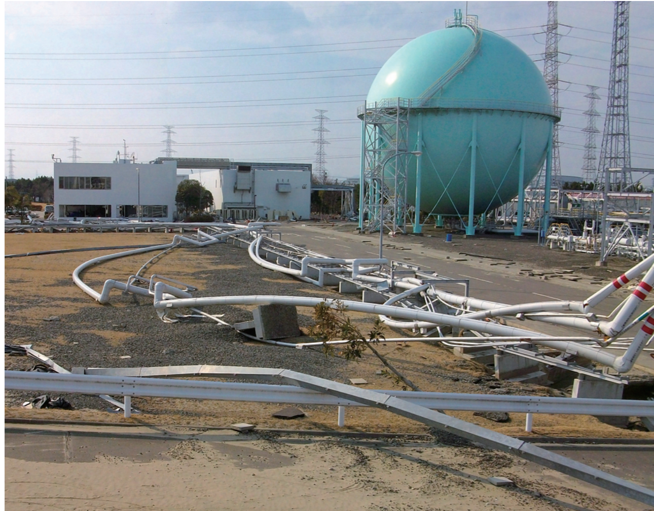
▲大きく曲がった、配管やダクト類。