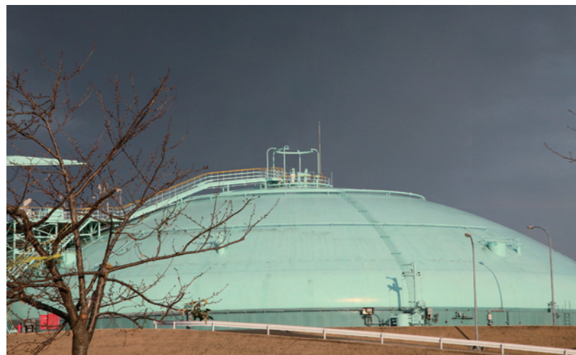
▲LNG タンク盛土上部は浸水を免れたが、電源を喪失。3月28日、それに伴う事態を改善するための保安措置をとった。