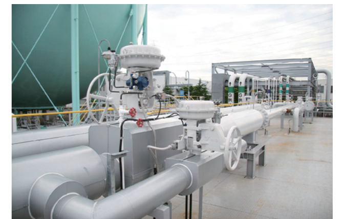
▲津波に襲われても無事だったパイプライン。