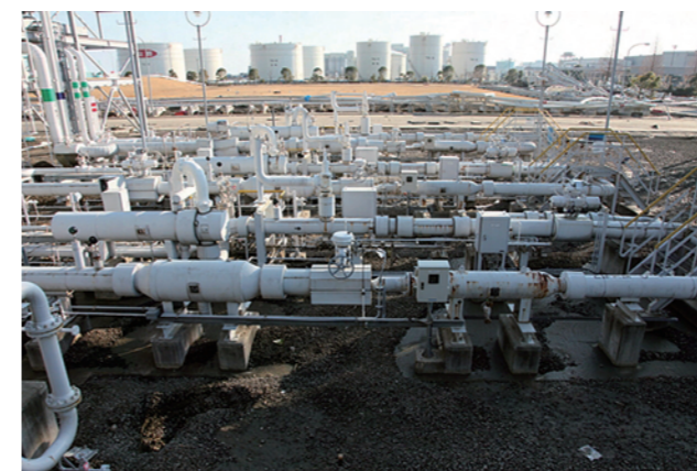
▲熱量調整設備は1～3号機が水没。敷き砂利が流出し、配管基礎が露出した。