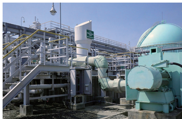
▲サブマージド式ペーパライザー (SMV) は全機器水没。フロア架台路盤部の砂利が流出した。