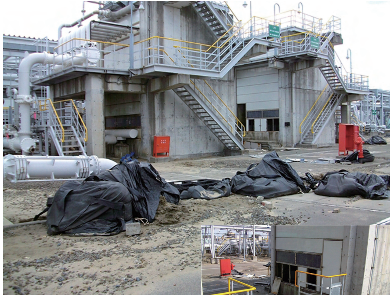
▲▶ ORVはフロア1階部分が水没。パネル内へ海生物や海砂が侵入、パネル扉が破損した。