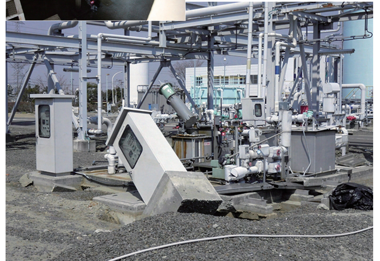
▲排水処理設備は制御盤と塩酸ポットファンが転倒。苛性貯槽に海水が流入し、配管が折損した。