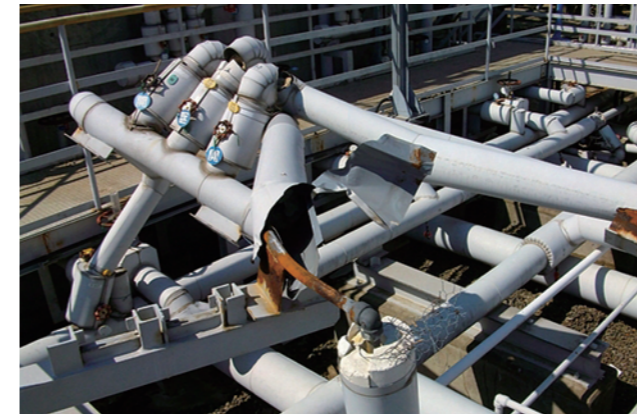
◀再冷水設備では凍結防止用蒸気配管が大破。再冷却塔の基礎地盤が流出し、ポンプ架台の基礎地盤が露出した。