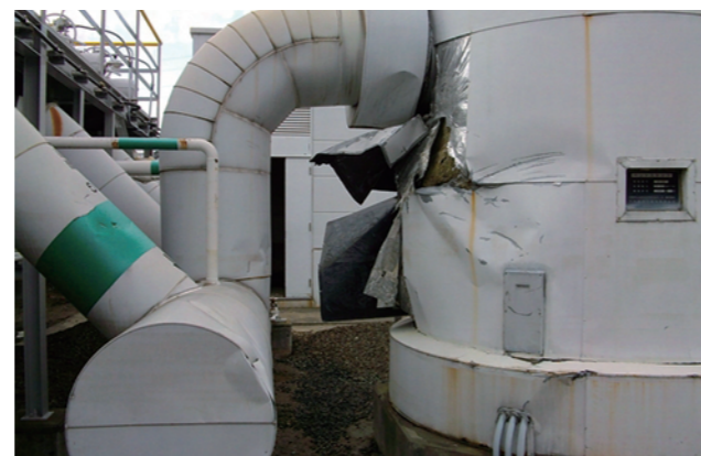
▲防音材板金が破損したVENTスタック。