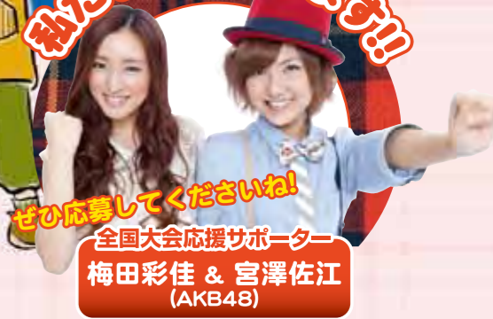
ぜひ応募してくださいね! 全国大会応援サポーター 梅田彩佳 & 宮澤佐江 (AKB48)